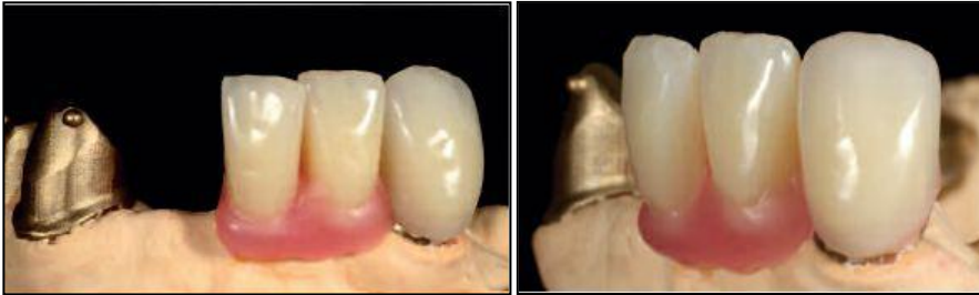
Abb. 5 und 6: Front- und Seitenansicht mit aufgeschliffener Facette und aufgestellten PALA Premium-Zähnen.