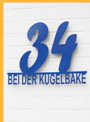
Hausnummern und Beleuchtung