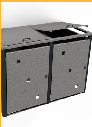
Mülltonnumhausungen und Mülltonnenboxen

Jetzt vorbestellen und sparen: www.thorwa.de