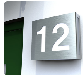
Gut sichtbar am Tag ...