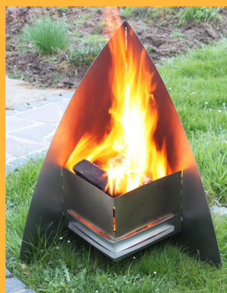
Feuerstellen, Terrassenöfen und Grillgeräte