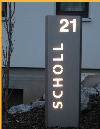
Beleuchtete Stelen auch mit Briefkasten / Klingel