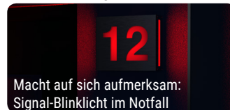
Macht auf sich aufmerksam: Signal-Blinklicht im Notfall

Mit diesen Komponenten wird das Hausnummernmodul zur vollwertigen und preislich attraktiven Sicherheitseinrichtung.