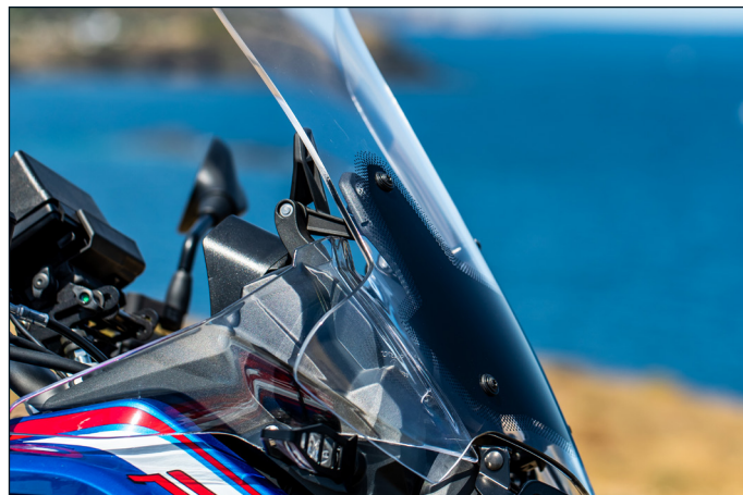
Wunderlich Verkleidungsscheibe »MARATHON« transparent an der BMW F 850 GS Adventure - Art.-Nr.: 43971-001

Die »MARATHON«-Verkleidungsscheibe für die BMW F 850 GS Adventure bietet Wunderlich mit 5 Jahren Garantie in transparent oder rauchgrau zum Preis von 179,90 Euro an.