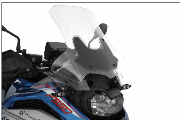
Die »MARATHON« für die BMW F 850 GS Adventure in transparent ... (Artikelnummer: 43971-001)