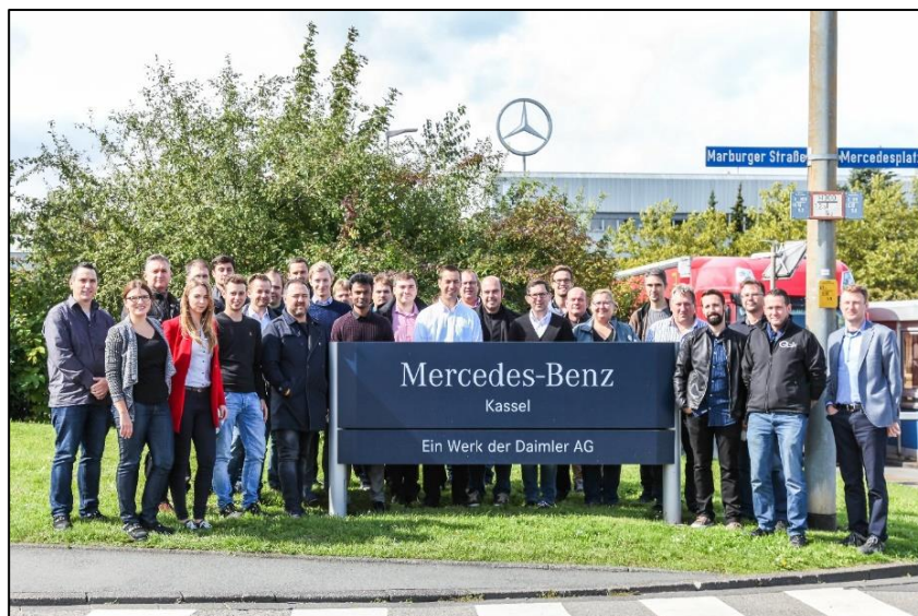
Werksbesichtigung im Mercedes-Benz Werk Kassel der Daimler AG

Wir freuen uns sehr, dass alle Teilnehmer so rege und aktiv mitgearbeitet und uns so viel positives Feedback gegeben haben. Aus der Sicht von Armbruster Engineering war auch das zweite ELAM-Anwendertreffen ein voller Erfolg, sodass die Veranstaltung auch in 2018 wieder stattfinden wird.