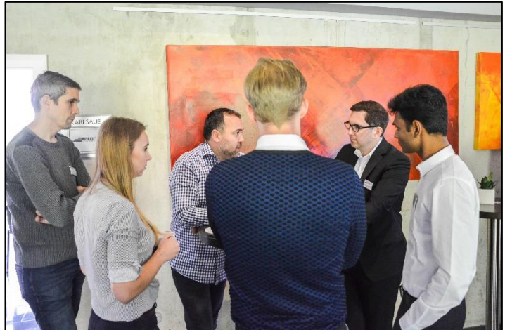
Auch Pausenzeiten wurden für den Austausch genutzt

Am Freitag folgte die mit Spannung erwartete Werksführung im Mercedes-Benz Werk Kassel der Daimler AG.