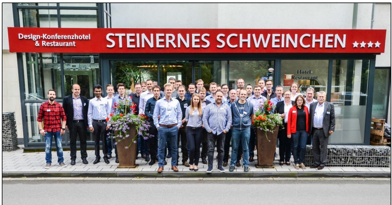
Die Teilnehmer des 2. ELAM-Anwendertreffen vor dem Tagungshotel "Zum Steinernen Schweinchen"

Neben dem Stand der Software, Diskussionen über Anwendungsgebiete und Gruppenworkshops, war am letzten Tag die spannende Werksbesichtigung des Mercedes-Benz Werkes der Daimler AG in Kassel mit Praxiseinblicken ein weiterer Höhepunkt.