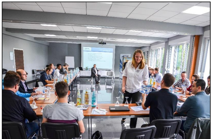
Gruppendiskussion über neue Technologien in der Produktion