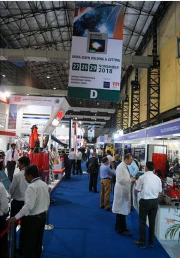
Messegeschehen auf der IEWC, Metallurgy India, Tube India und Wire & Cable.