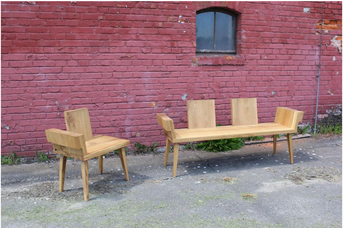
Titel: »Prosa« aus heimischer Eiche wird als Bank und als Stuhl mit einer oder zwei Armlehnen angeboten.