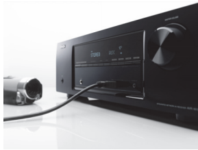
AVR-1513 mit Camcorder am Front-HDMI-Anschluss

http://www.denon.eu/downloads/press/2012_AVR-xx13/de_avr1513_e2_bk_ot_bg001_hi.tif