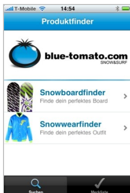
Snowboard- und Snowwearfinder