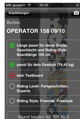
Reasonings bzw. Begründung der Produktempfehlung

Die iPhone App kann als mobile Schnittstelle an sämtliche excentos Online Produktberater angebunden werden. Sie greift dabei direkt auf excentos' Guided Selling-Server zu, um die am besten passenden Produktempfehlungen zu berechnen und auch Bilder in perfekter Zoomqualität anzufordern. excentos bietet die iPhone-Apps sowohl als Zusatz zu bestehenden Online-Beratern, als auch unabhängig davon (also nur als mobile Beratungsanwendung) an und wird auch weitere Smartphones abdecken.