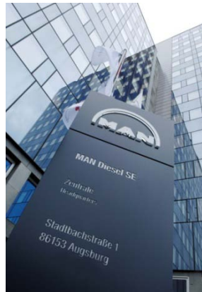
2 Zentrale von MAN Diesel in Augsburg