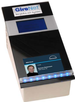
1 Lesegerät zur bargeldlosen Bezahlung