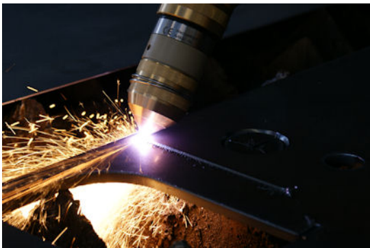
Bild 4: Sonderpreis: „Plasmaschneiden mit HiFocus - Fasenschnitt mit Präzision“ Kjellberg Finsterwalde Plasma und Maschinen GmbH, Nicole Dönicke, Finsterwalde*

* Die Bilder dürfen nur im Zusammenhang mit dem DVS-Fotowettbewerb 2010 und mit Quellennachweis aus der Bildunterschrift veröffentlicht werden.