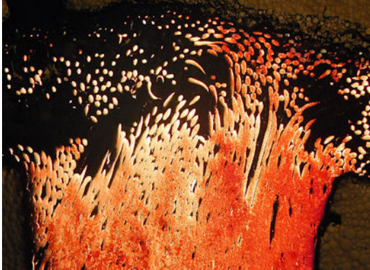
Bild 2: „Schweißgut einer Elektronenstrahlschweißung von Elektrolyt-Kupfer“ TU Braunschweig, Institut für Füge- und Schweißtechnik, Abteilung Werkstoffe und Analytik*