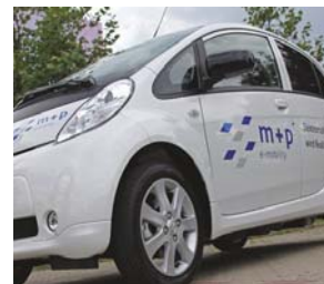
Viel praktischer Fahrspaß