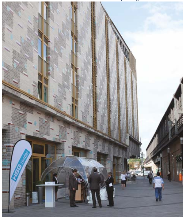
Eventpassage | Bernhardt Link

Der Kongress selbst ist an interessiertes Fachpublikum gerichtet. Die Energieeffizienz ist Grundlage der eingeschlagenen Energiewende und Themenschwerpunkt des ersten Kongresstages. Mit Beiträgen aus der Praxis soll aufgezeigt werden, wie ambitionierte Ziele bereits heute mit verfügbaren Technologien wirtschaftlich realisiert werden können.