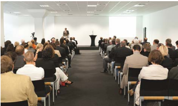
Eventpassage | Bernhardt Link

Von der Konzeption, über die Realisierung mit effizienten Einzelkomponenten, bis hin zu einem laufenden Verbesserungsprozess im Energiemonitoring werden praktikable Perspektiven aufgezeigt. Finanzierungsansätze im Rahmen von Contractinglösungen runden den ersten Tag ab.