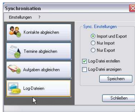
Abb1. Manueller Aufruf der Synchronisation

Zum Abgleich der Daten mit einem Smartphone wird Microsoft ActiveSync® verwendet. Ein Handy, Smartphone oder PDA wird per USB mit dem Arbeitsplatz verbunden und so automatisch mit synchronisiert.