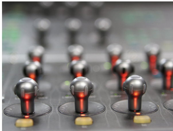
Mischung Studio A - HD-Mischpult