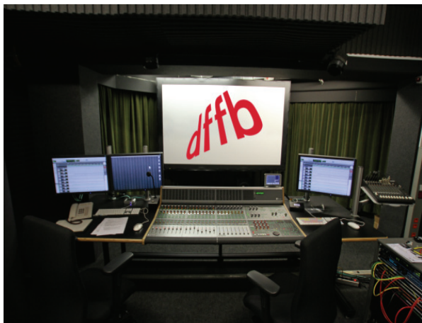
Mischung Studio A-Raum mit HD-Mischpult und HD-Audio-Komponenten sowie schalltransparenter Leinwand