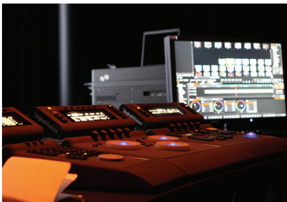
Grading-Suite: Zentraler Finishing-Bereich mit echtzeitfähigem Gradingssystem, Rasterizer und HD-Vorschau-monitor (Eizo)