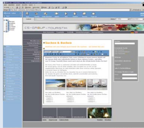
Schnell und einfach: Editieren mit ContentServ