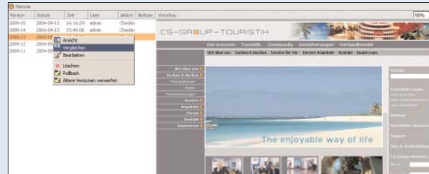
Übersichtliche Verwaltung von Versionen