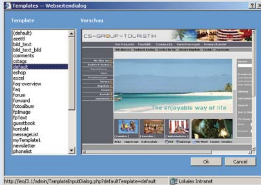
Auswahlmöglichkeit von Templates mit Vorschau