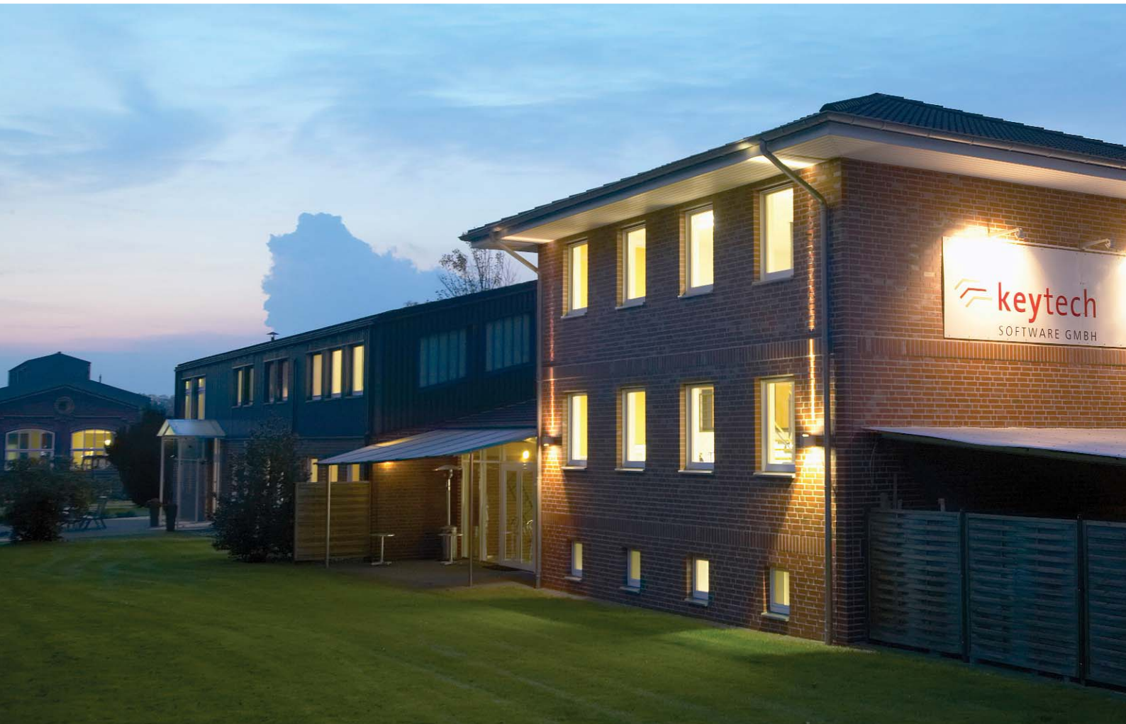
keytech Software GmbH, Recklinghausen (Deutschland)

„Der Erfolg von Microsoft beruht auf den Produkten, aber vor allem auch auf dem Knowhow und dem Einsatz unserer Partner vor Ort. Gerade die enge Zusammenarbeit mit unseren Partnern macht es möglich, Microsoft-Produkte optimal auf die Markterfordernisse und Kundenwünsche abzustimmen. Das Gütesiegel 'Microsoft Gold Certified Partner' ist somit ein wichtiger Nachweis von Kompetenzen und eine wichtige Entscheidungshilfe für Kunden. Die keytech Software GmbH gehört zur exklusiven Gruppe dieser Partner, mit denen wir in Deutschland besonders eng zusammenarbeiten.“