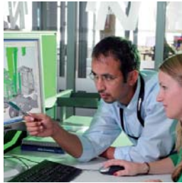
Sennebogen Maschinenfabrik GmbH, Straubing (Deutschland)

Nicht nur die gesamtwirtschaftlichen, auch die betrieblichen Zusammenhänge werden immer komplexer. Damit gewinnt ein durchgängiges Datenmanagement als Steuerungsinstrument enorm an Bedeutung. Das Zusammenwirken aller beteiligten Unternehmensbereiche gilt es so aufeinander abzustimmen, dass der Produktentwicklungsprozess über den gesamten Lebenszyklus optimal unterstützt wird.