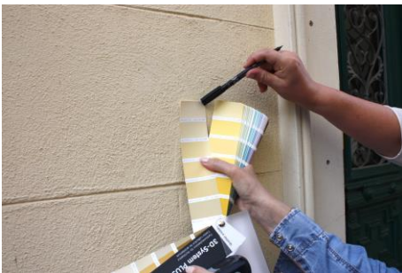
„Making of... ColorResearch“