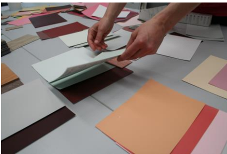
„Making of... Farbdesign“