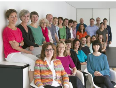
Caparol FarbDesignStudio (FDS): ein kreatives Team