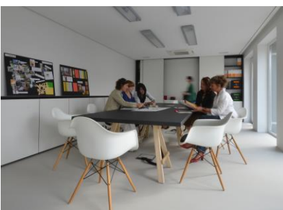
FDS: Diskussion und Abstimmung ist Teil jedes kreativen Entwicklungsprozesses.